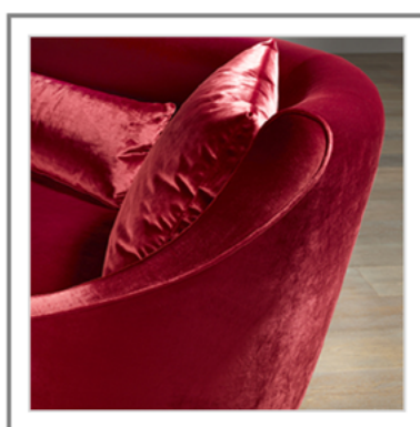
ZIA MARIA _ Dettaglio bracciolo. | Arm detail view.