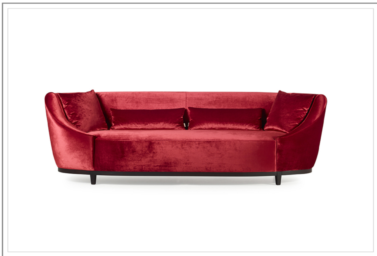
ZIA MARIA _ Divano da 260cm con rivestimento in tessuto. | Sofa w.260cm with fabric cover.