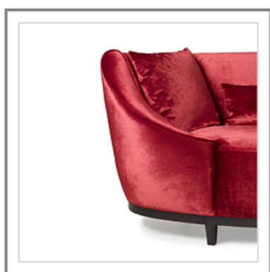
ZIA MARIA _ Dettaglio forma schienale. | Close-up of backrest shape.