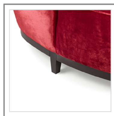
ZIA MARIA _ Dettaglio basamento in Faggio tinto moka. | Close-up: base in Moka beechwood.