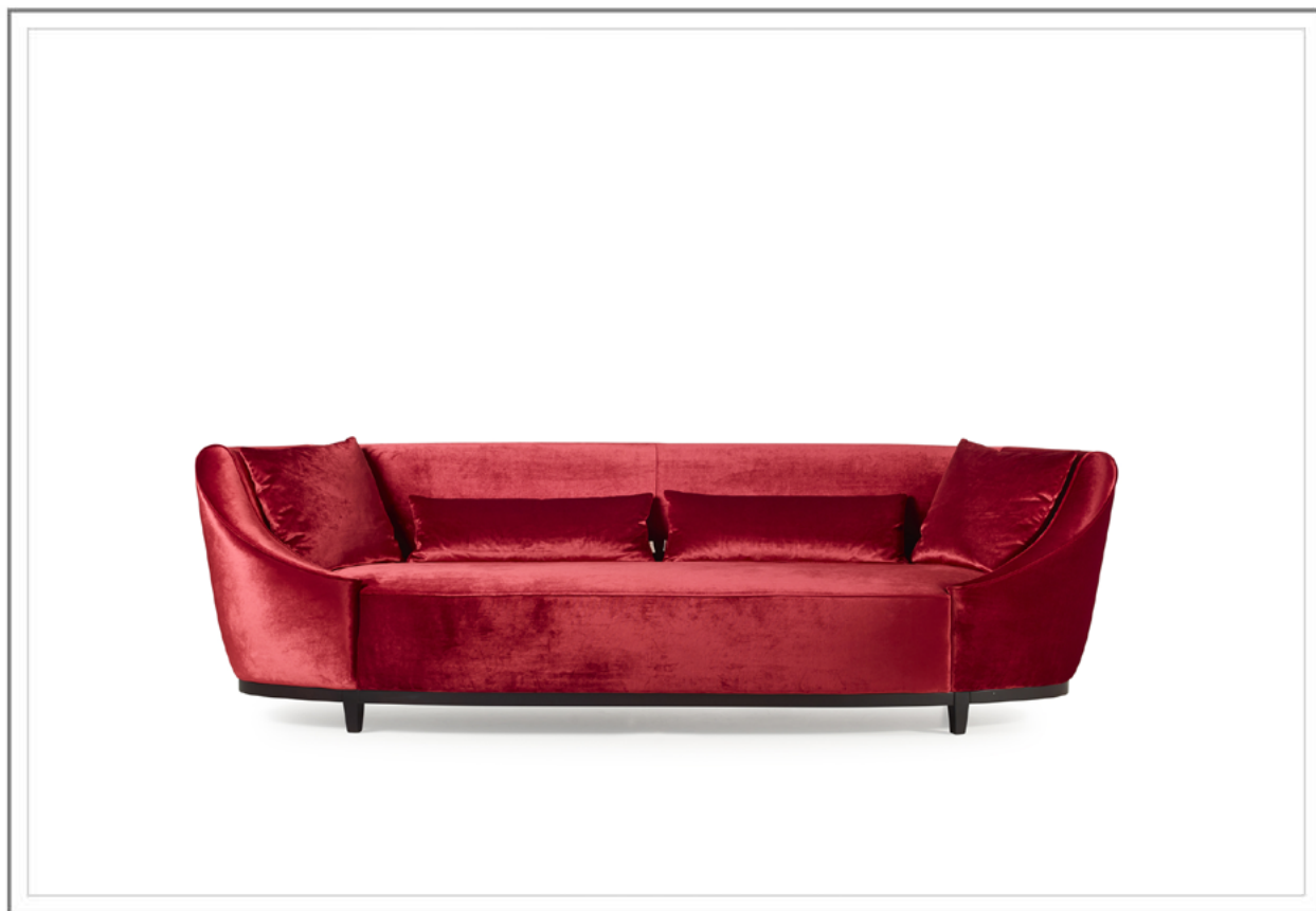
ZIA MARIA _ Divano da 260cm con rivestimento in tessuto. | Sofa w.260cm with fabric cover.