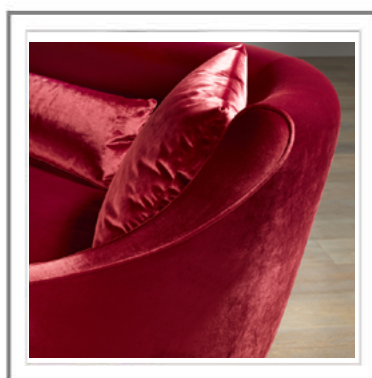
ZIA MARIA _ Dettaglio bracciolo. | Arm detail view.