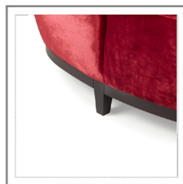
ZIA MARIA _ Dettaglio basamento in Faggio tinto moka. | Close-up: base in Moka beechwood.