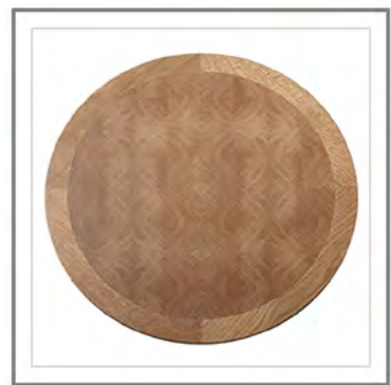
FILIBERTO_ Top intarsiato. | Inlaid top.