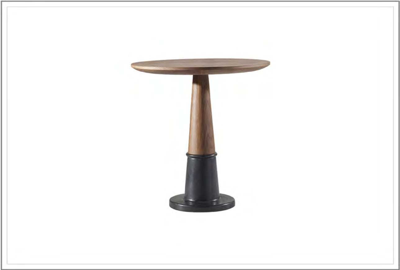
FILIBERTO _ Tavolino da caffè. Struttura in legno massiccio di Rovere spazzolato, finitura Cognac. Base in fusione d'ottone, finitura annerita, rifinita a mano. | Coffee table. Top and structure in brushed oak (solid wood) Cognac stained finish. Base in cast brass, blackened finish, refined by hand.