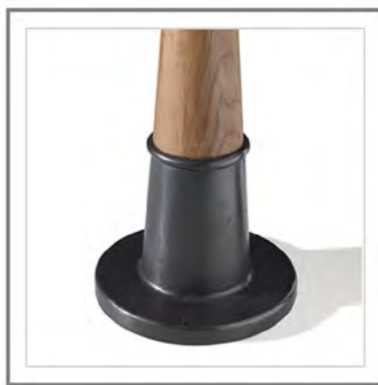
FILIBERTO_ Dettaglio base in fusione d'ottone, finitura annerita, rifinita a mano. | Close-up: base in cast brass, blackened finish, refined by hand.