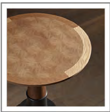
FILIBERTO_ Vista dall'alto top intarsiato. | Top view: Inlaid top.