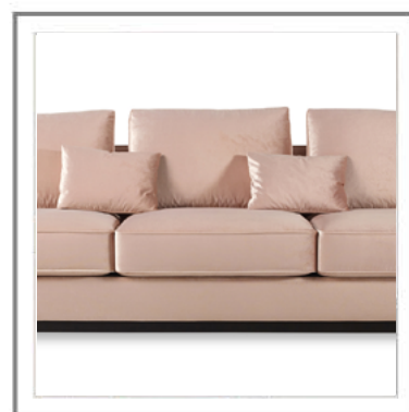
CARLOTTA _ Dettaglio cuscino di seduta e schienale. Cuscini decorativi (optional). Close-up: seating and back pillows. Decorative pillows (optional).