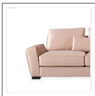
CARLOTTA _ Dettaglio bracciolo con piedino standard. | Arm detail and foot view.