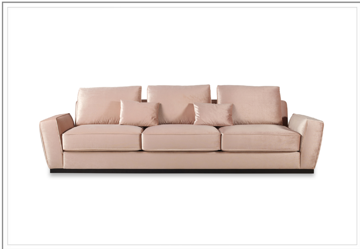
CARLOTTA _ Divano rivestito in tessuto con base in frassino tinto moka (optional). Cuscini decorativi (optional) | Fully upholstered Sofa in fabric, base in solid moka stained ashwood (optional). Decorative pillows (optional).