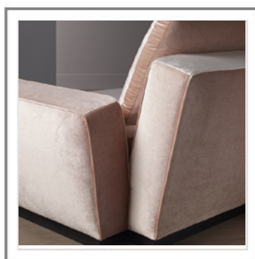
CARLOTTA _ Dettaglio forma schienale. | Close-up of backrest shape.