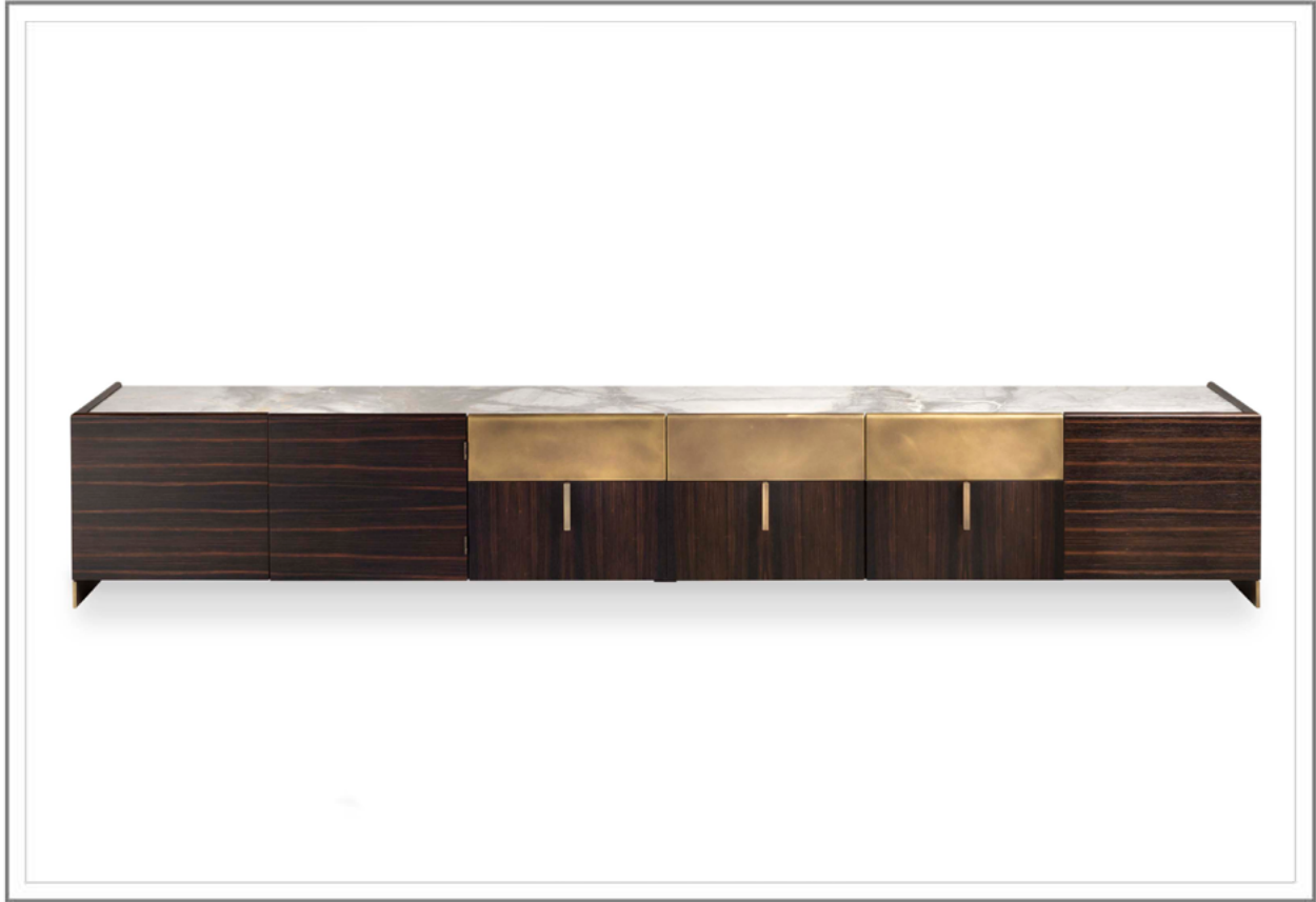
MILANO_ Credenza in ebano L.300cm con dettagli in ottone, finitura Nuvola. | Sideboard W.300cm in ebony with details in brass, Nuvola finish.