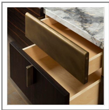
MILANO_ Dettaglio cassetti con frontale in ottone, finitura Nuvola. | Detail view: Frontal drawers clad in brass, Nuvola finish.