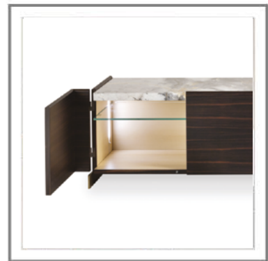
MILANO_ Vista interna in finitura acero naturale con mensola in vetro extra-chiaro (Optional). | Inner view: natural maple finish with extra-clear glass shelf (Optional).