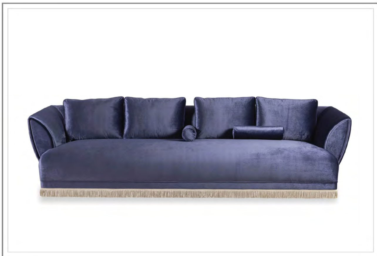
AVUELA_ Divano L.310cm con seduta a molle e rivestimento in velluto. | Sofa W.310 cm, seat with coil springs, upholstered in velvet.