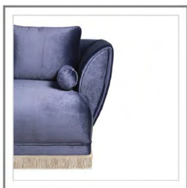
AVUELA_ Dettaglio: bracciolo. | Close-up: arm detail.