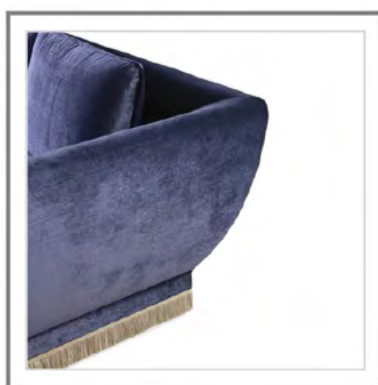
AVUELA_ Vista laterale. | Side view.