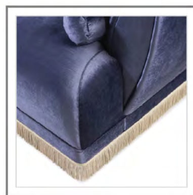
AVUELA_ Dettaglio basamento con passamaneria estetica colore beige. | Close-up: Base with decorative beige fringes.