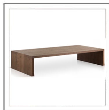
TAO_ Tavolino in rovere tinto cenere | Coffee table in solid cenere stained oak.