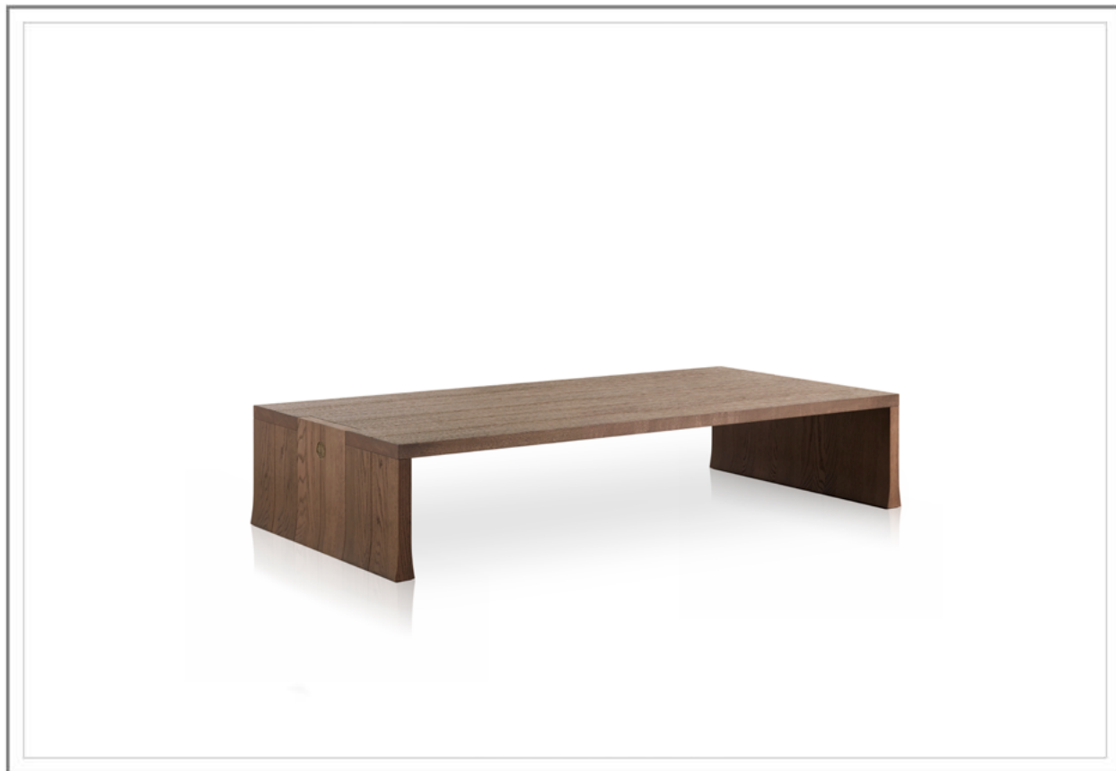
TAO_ Tavolino in rovere tinto cenere | Coffee table in solid cenere stained oak.