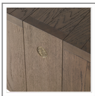
TAO_ Dettaglio top e piastrina in fusione di ottone, finitura bronzo antico | Close-up of the top and metal plate detail in cast brass, antique bronze finish.