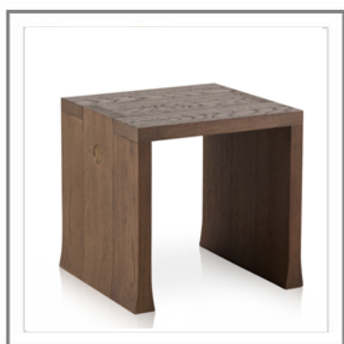
TAO_ Tavolino L-52cm in rovere tinto cenere | Side table W.52 cm in solid cenere stained oak.