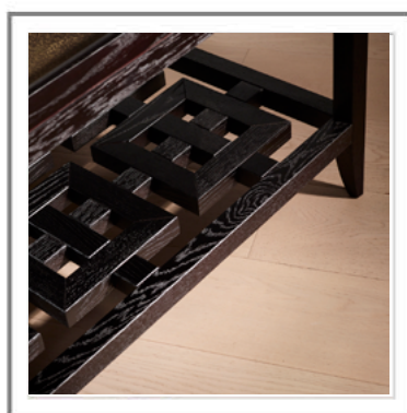
SHENZHEN_ Dettaglio basamento in massiccio di rovere tinto moka | Close-up: base in solid moka stained oak.