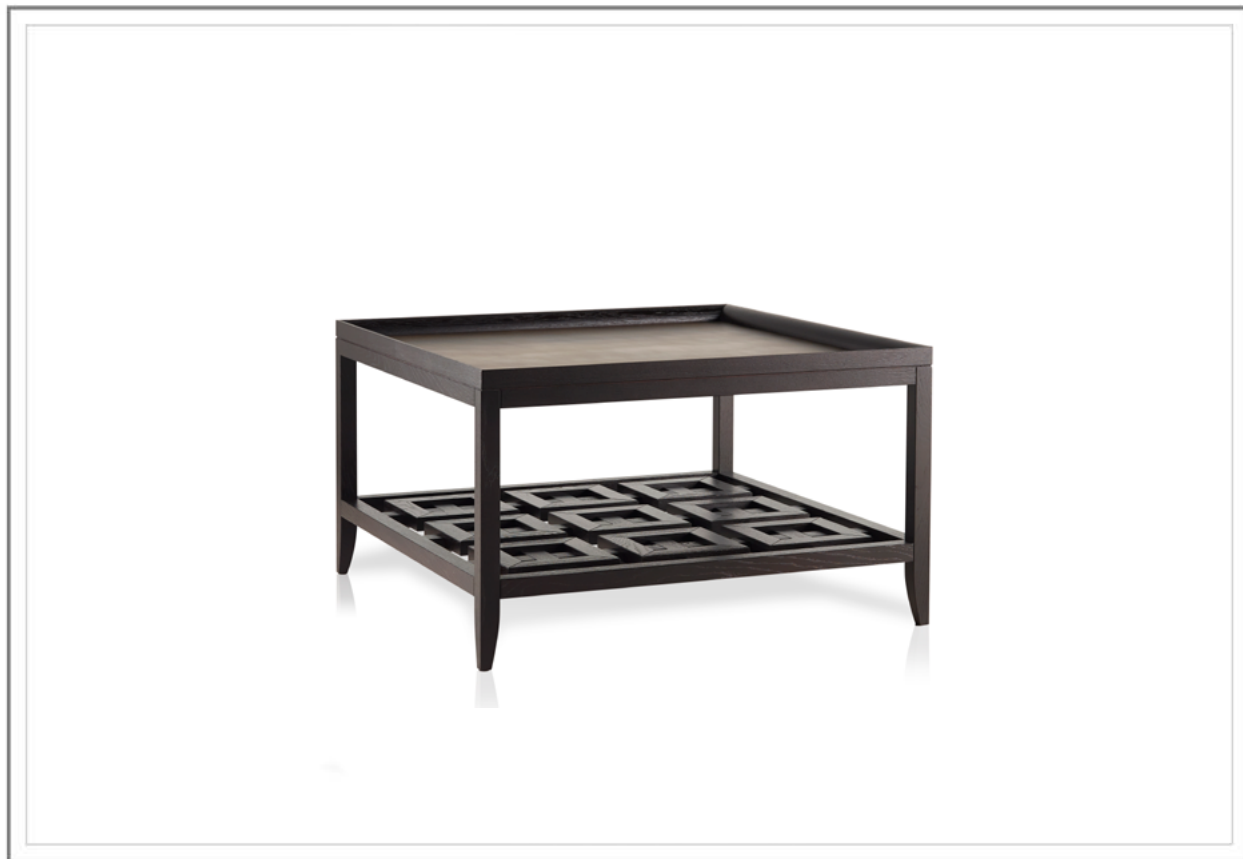
SHENZHEN_ Tavolino con struttura in legno massiccio di rovere, tinto moka con inserto top in ottone martellinato finitura bronzo antico (optional) | Side table in solid moka stained oak with top insert in hammered brass, antique bronze finish (optional).