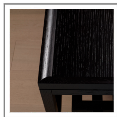
SHENZHEN_ Dettaglio top in rovere tinto moka | Top detail in solid moka stained oak.