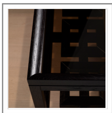
SHENZHEN_ Dettaglio top con cornice in rovere tinto moka ed inserto in vetro bronzato (optional) | Detail view: Top with frame in solid moka stained oak with insert in bronzed glass (optional).