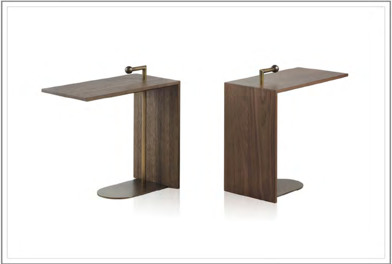
DON PEDRO_ Tavolino con struttura in rovere massiccio tinto grigio (sinistra) e massiccio di noce canaletto tinto scuro (destra) | Side table in solid grey oak (on the left) and in solid dark stained american walnut (on the right).