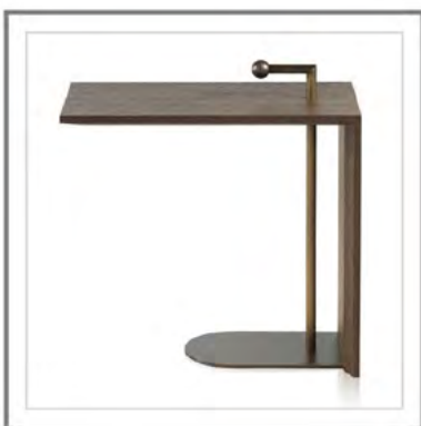
DON PEDRO_ Vista frontale tavolino in rovere grigio con maniglia e dettagli in fusione di ottone martellinata, finitura bronzo antico | Frontal view: side table in grey oak with handle and details in hammered cast brass, antique bronze finish.