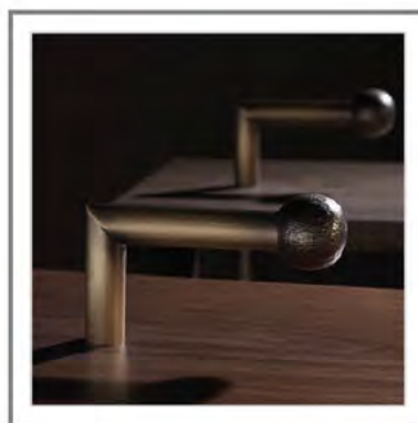
DON PEDRO_ Dettaglio maniglia in fusione di ottone martellinata, finitura bronzo antico | Close-up handle in hammered cast brass, antique bronze finish.