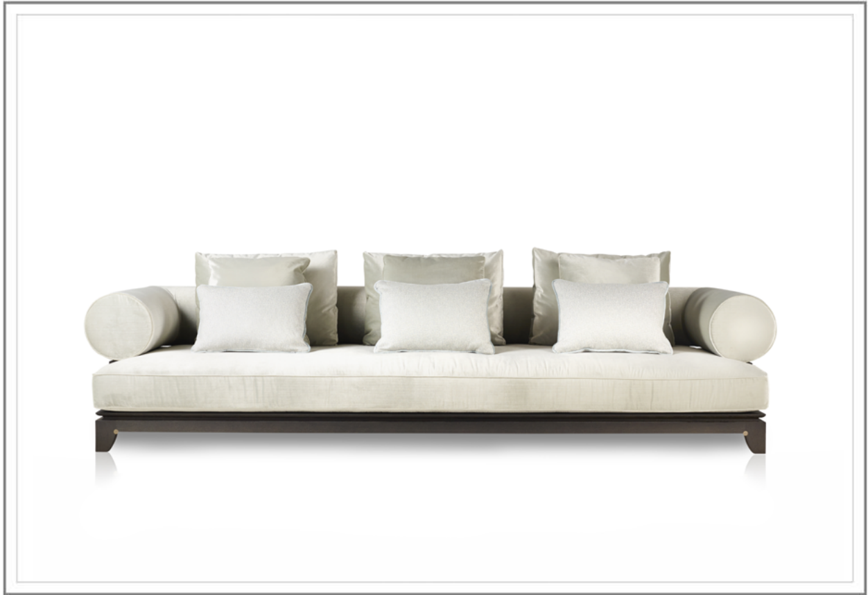
DULCECHINA_ Divano con struttura in rovere tinto moka, rivestimento in velluto | Sofa with structure in solid moka stained oak, upholstered in velvet.