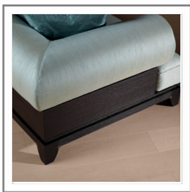
DULCECHINA_ Vista laterale | Side view.