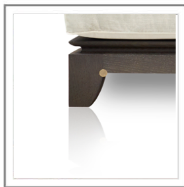
DULCECHINA_ Dettaglio inserto in ottone, finitura bronzo antico | Round insert in brass, antique bronze finish.