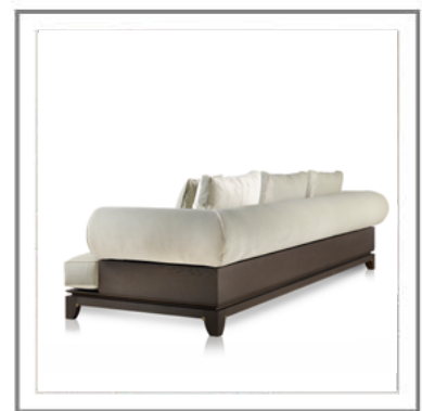
DULCECHINA_ Vista retro divano con struttura in rovere tinto moka | Back view: structure in solid moka stained oak.