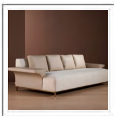
GEROGE V_ Dettaglio divano con doppio rivestimento tessuto e pelle (su richiesta) | Detail view: sofa upholstered in fabric and leather (upon request).