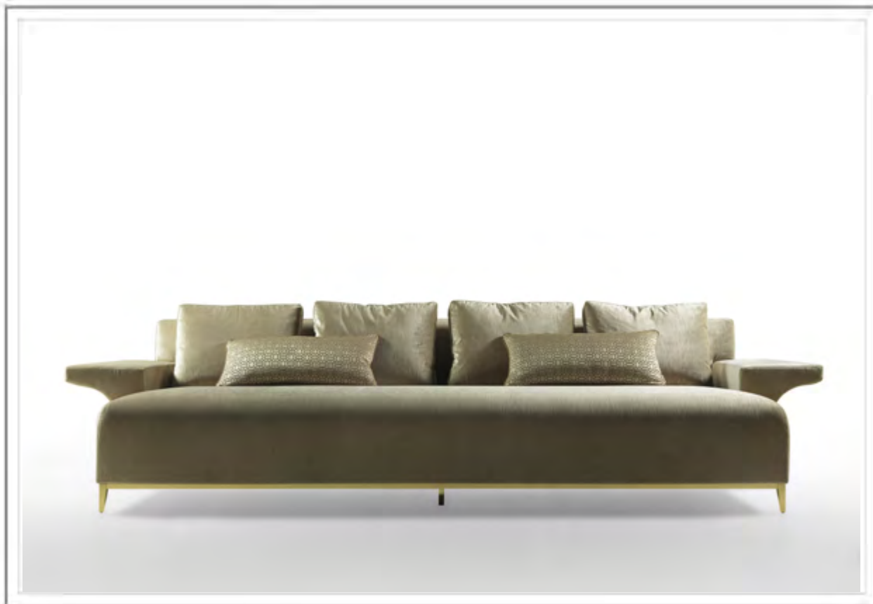
GEROGE V_ Divano con base in ottone, finitura bronzo antico e rivestito in velluto | Sofa with base in brass, antique bronze finish upholstered in velvet.