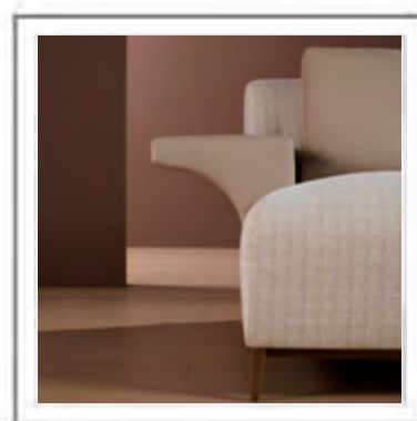
GEROGE V | Dettaglio bracciolo | Closeup of the armrest