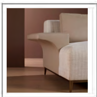
GEROGE V | Dettaglio bracciolo | Closeup of the armrest