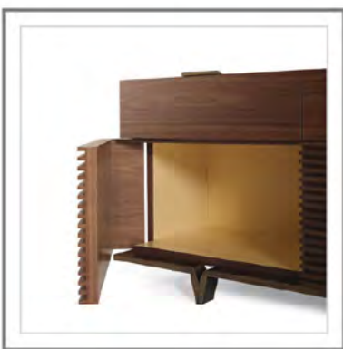
MONTMARTRE_ Interno in acero naturale e base in fusione d'ottone martellinata, finitura bronzo antico | Inner finish in natural maple, base in hammered cast brass, antique bronze finish.