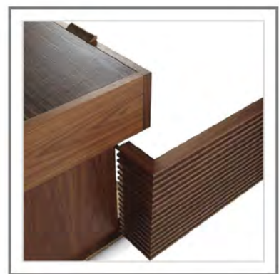
MONTMARTRE_ Dettaglio anta a forma di "L" e cerniera in ottone ideata da Bellavista Collection | "L" shape door view and inhouse design hinge in brass, by Bellavista Collection.