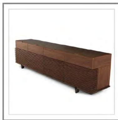
MONTMARTRE_ Vista laterale credenza | Sideboard side view.