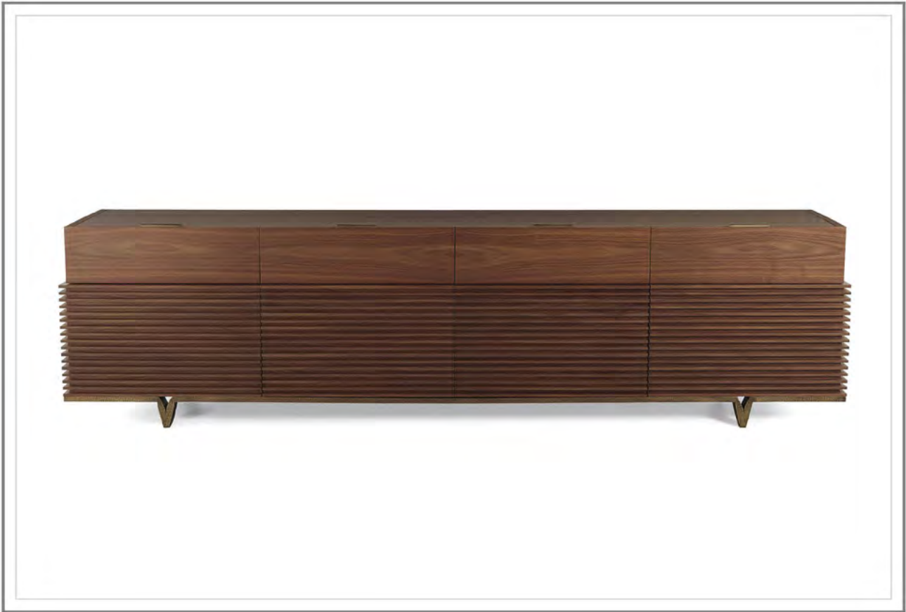
MONTMARTRE_ Credenza in noce canaletto tinto scuro con base in fusione d'ottone martellinata, finitura bronzo antico e top in marmo Tobacco (optional su richiesta) | Sideboard in dark stained walnut with base in hammered cast brass, antique bronze finish. Top in Tobacco marble (optional, upon request)