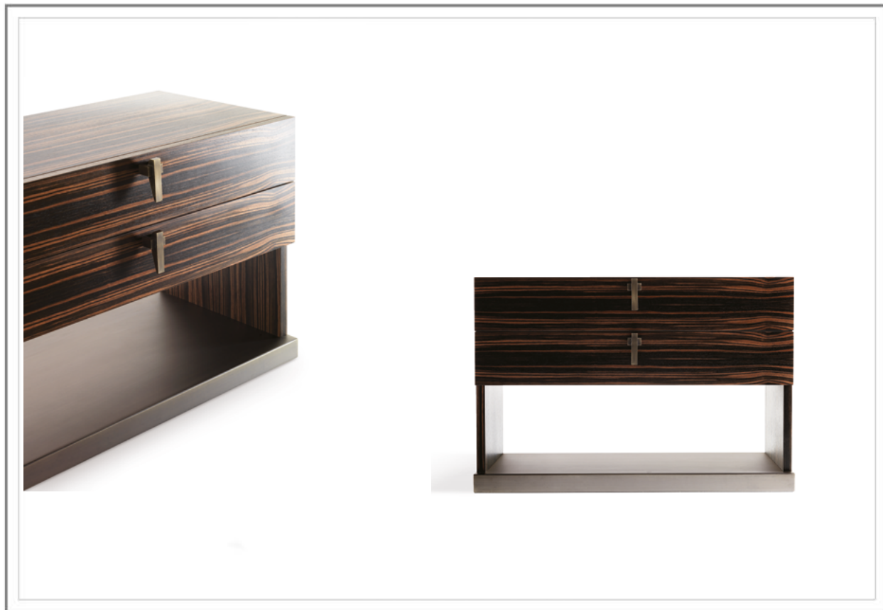
CALIFORNIA_ Comodino L. 90 cm in ebano con base in metallo, finitura bronzo antico | Nighstand w. 90 cm in ebony with base in metal, antique bronze finish.