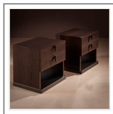
CALIFORNIA_ Comodini L. 60 cm in rovere grigio | Nightstands w. 60 cm in grey oak.