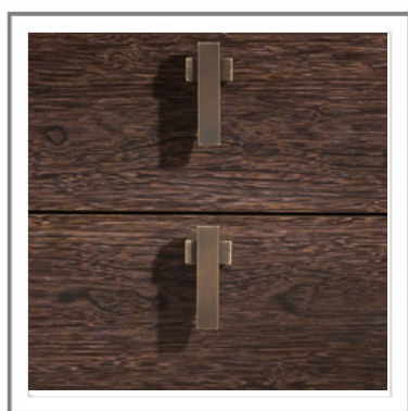
CALIFORNIA_ Vista maniglie | Close-up handles.