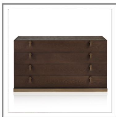
CALIFORNIA_ Comò in rovere grigio | Drawers unit in grey stained oak